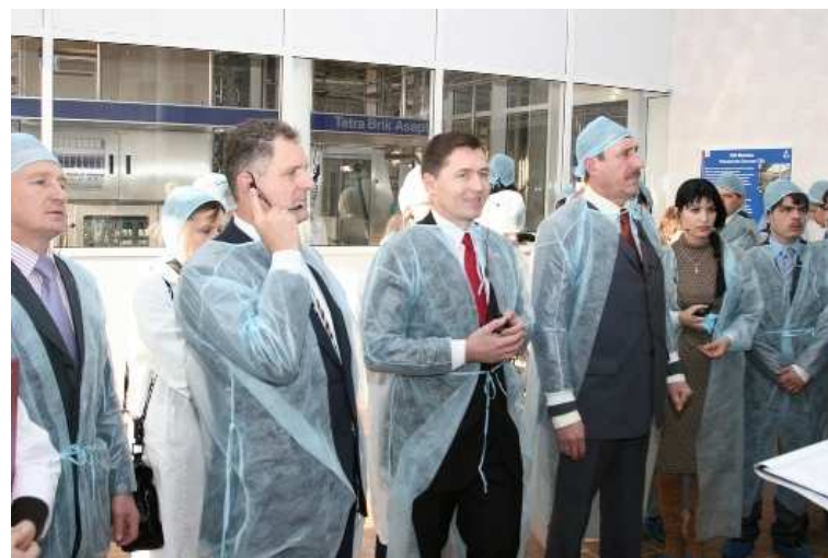
Президент Удмуртской Республики А.А. Волков на открытии линии по производству «школьного молока» на ОАО МК «Сарапул-молоко»