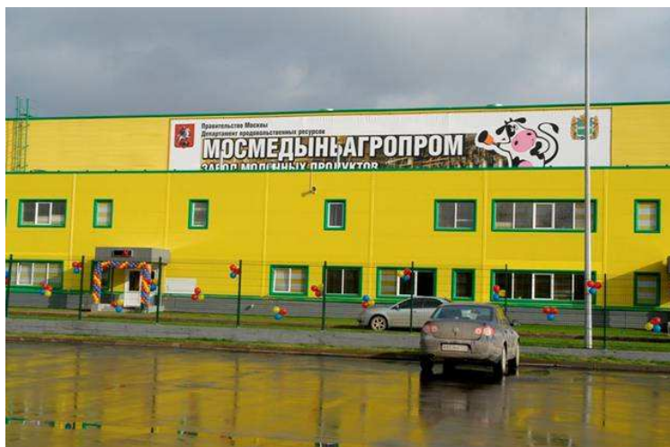
Завод «Школьное питание» Правительства Москвы. Калужская область. Пос. Медынь.